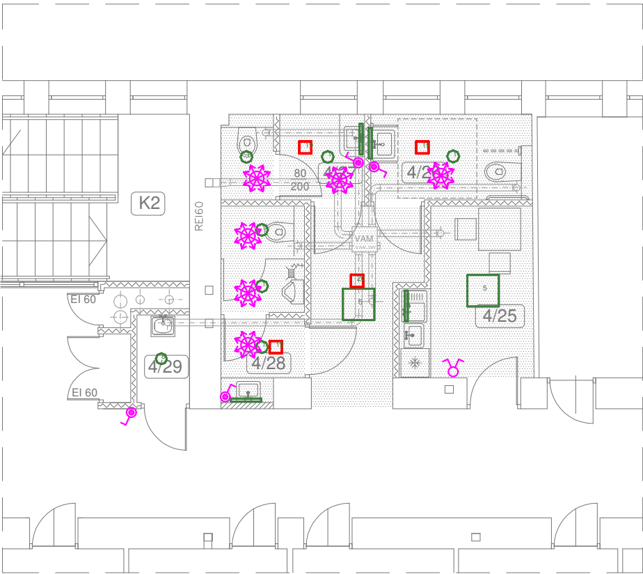
RZUT III PIĘTRA – I ETAP skala 1:100

Projektowane nowe obwody na piętrze II i III należy tymczasowo zasilić z lokalnych rozdzielnic. Obwody zostaną przepięte do nowych rozdzielnic w kolejnym etapie. Należy przewidzieć dodatkowy obwód dla zasilenia wentylatora wyciągowego zbiorczego VAM, obwód ten należy dodatkowo zabezpieczyć Wyłącznikiem silnikowym 0,63–1A.